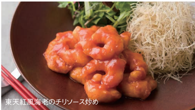
東天紅風海老のチリソース炒め