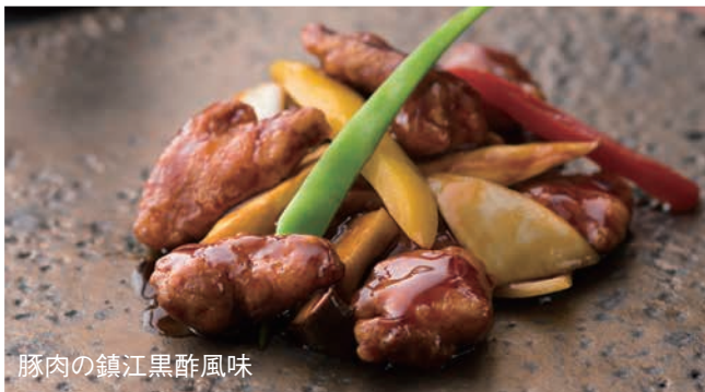
豚肉の鎮江黒酢風味