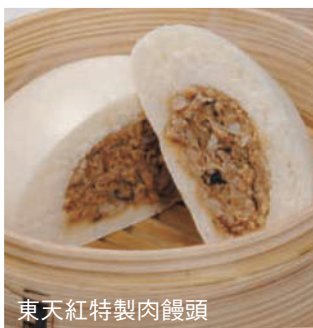
東天紅特製肉饅頭